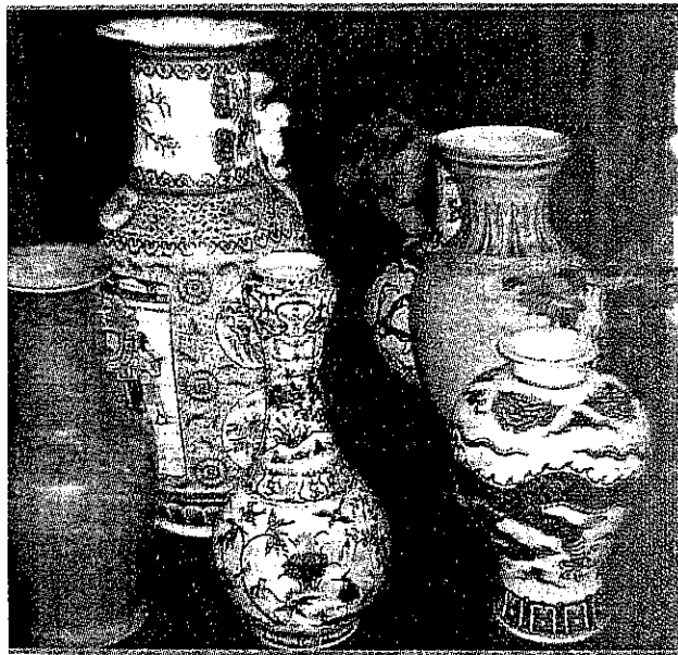
行政執行處從林姓義務人處查封等待拍賣的物品，從太奇（右圖）、珠寶、骨董花瓶（上圖）、日常電氣用品等盡有。（記者黃美珠翻攝）

但其家人聲稱，原來的公司早已沒有賺錢，何來所得盈餘可以分配？而他也疑因患老人癡呆症