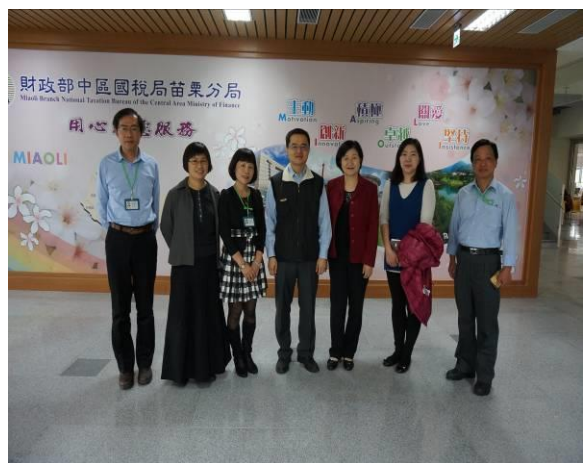
拜會國稅苗栗分局(2)