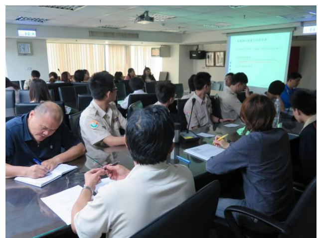
個人資料保護法專題演講(2)