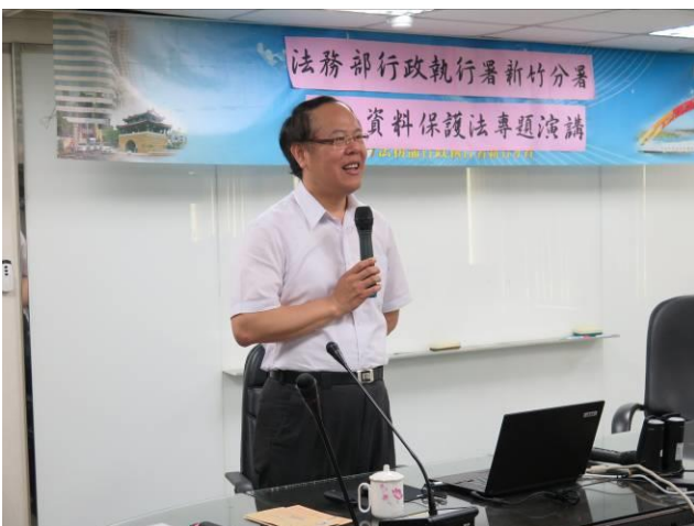
個人資料保護法專題演講(1)