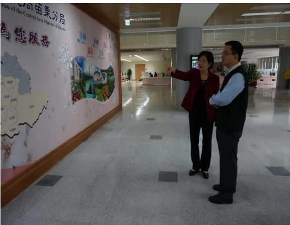
拜會國稅苗栗分局(1)