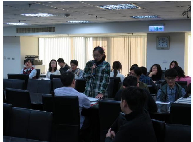
新進書記官自我介紹(4)