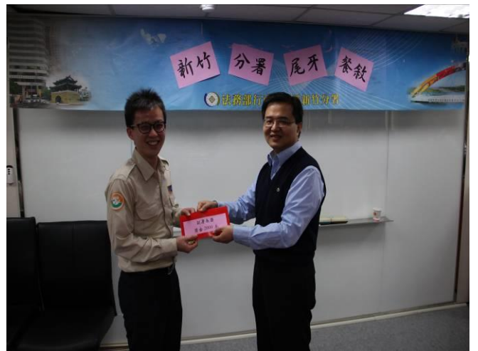
尾牙餐敘活動情形(8)