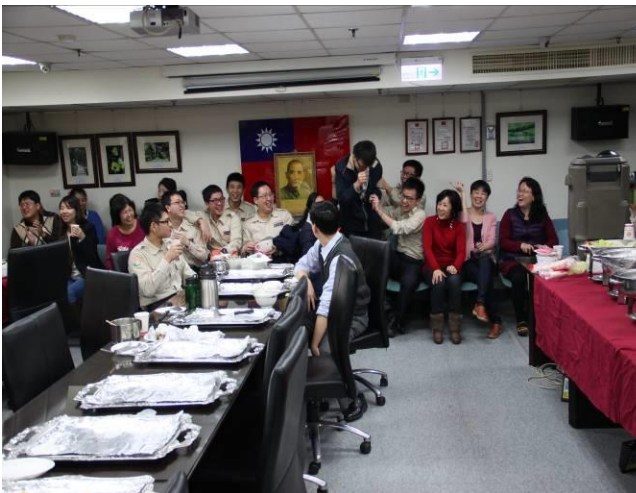
尾牙餐敘活動情形(7)