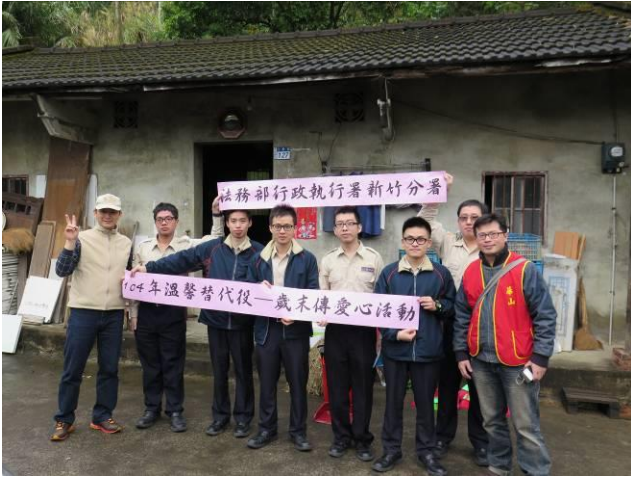
歲末傳愛心活動情形(1)