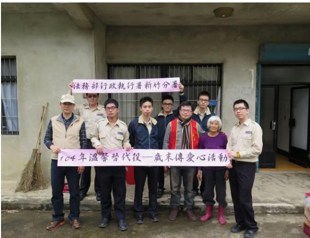
歲末傳愛心活動情形(3)