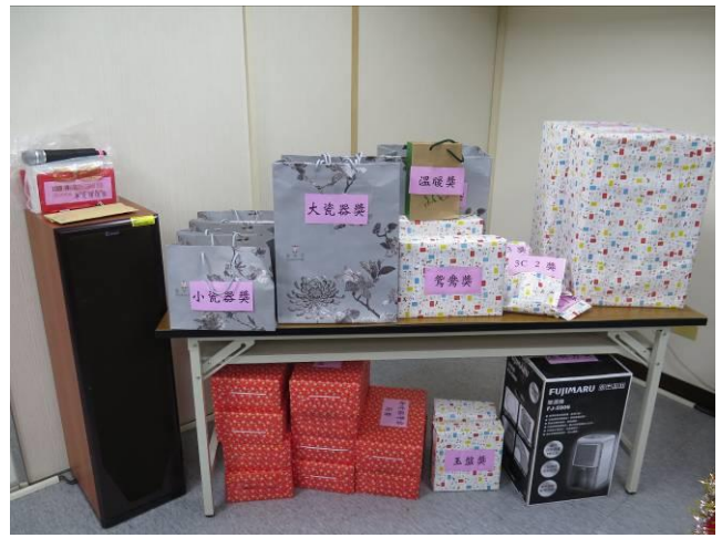
尾牙餐敘活動情形(4)