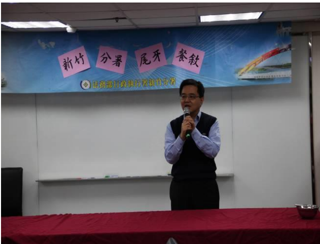
尾牙餐敘活動情形(1)