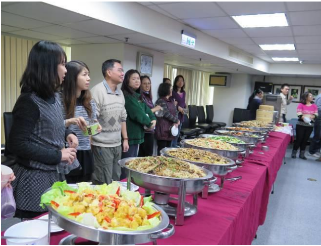
尾牙餐敘活動情形(3)