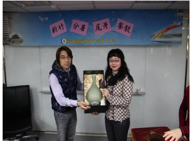
尾牙餐敘活動情形(6)