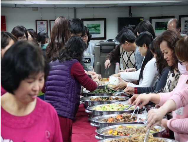
尾牙餐敘活動情形(5)