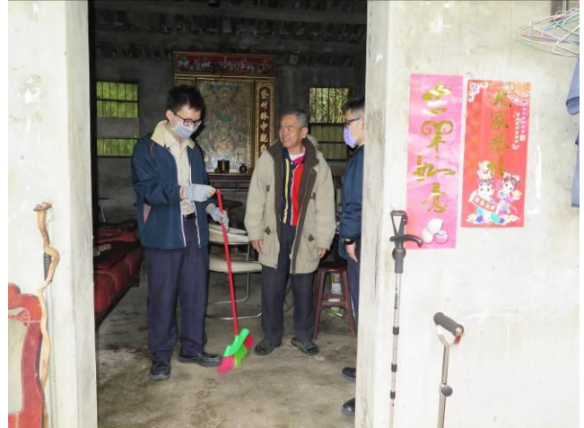
歲末傳愛心活動情形(2)