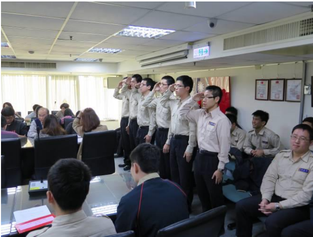
新進役男自我介紹(3)