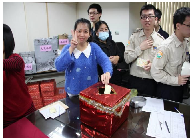
尾牙餐敘活動情形(1)