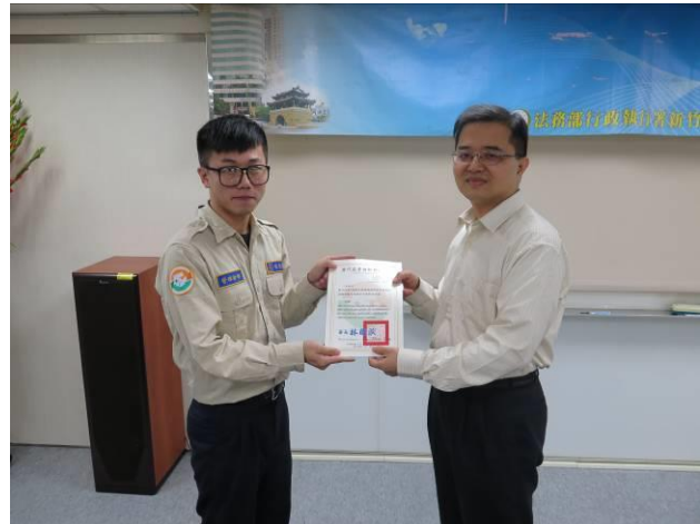
分署會議頒獎情形(2)