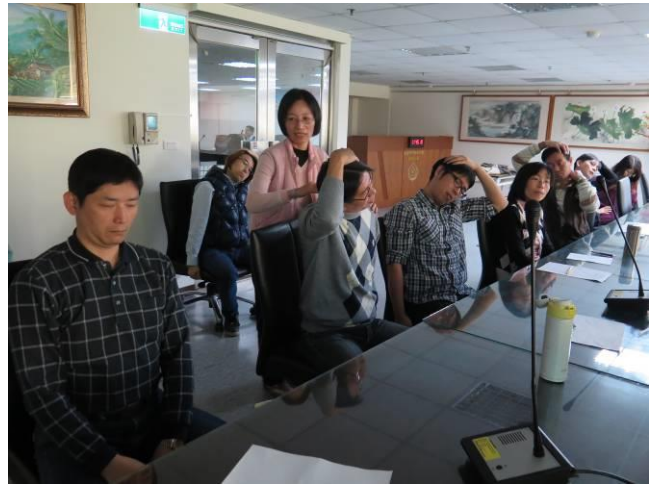
健康體適能運動概念專題演講情形(2)