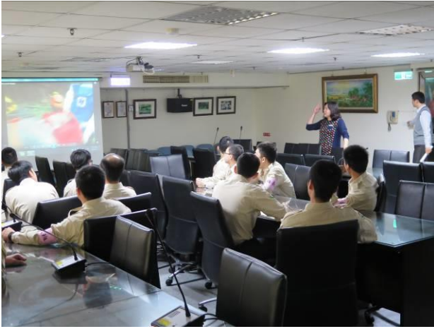
消防安全教育及天然災害避難演練情形(1)