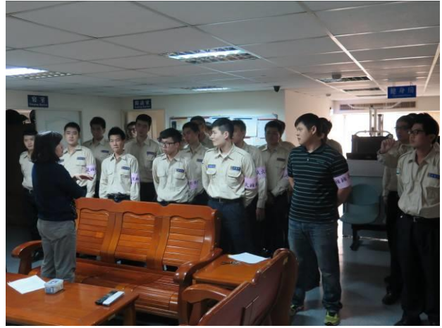
消防安全教育及天然災害避難演練情形(2)