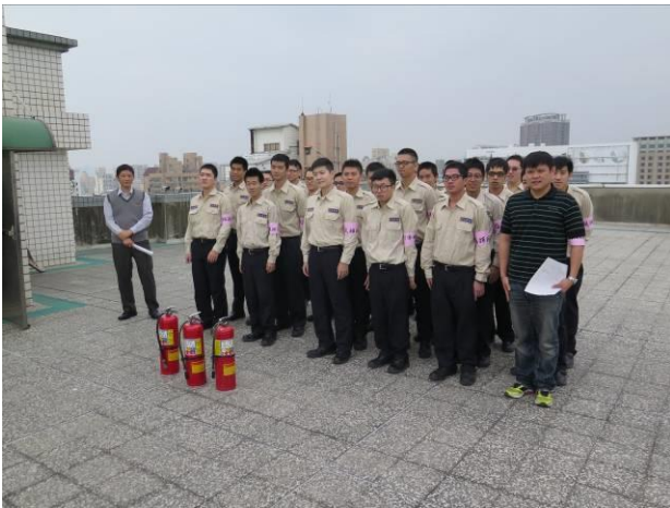
消防安全教育及天然災害避難演練情形(3)