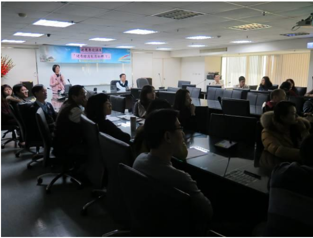
健康體適能運動概念專題演講情形(1)