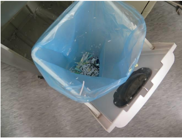
第二季媒體檔案銷毀情形(3)