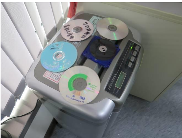
第二季媒體檔案銷毀情形(1)