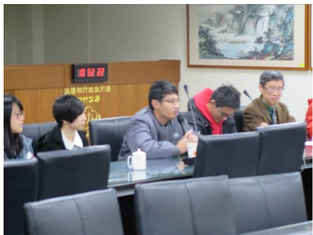
實習服務綜合座談情形(2)