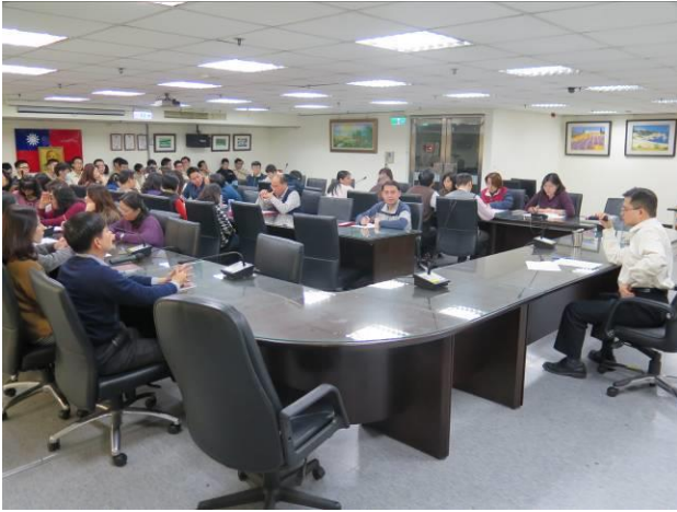
分署會議開會情形(1)