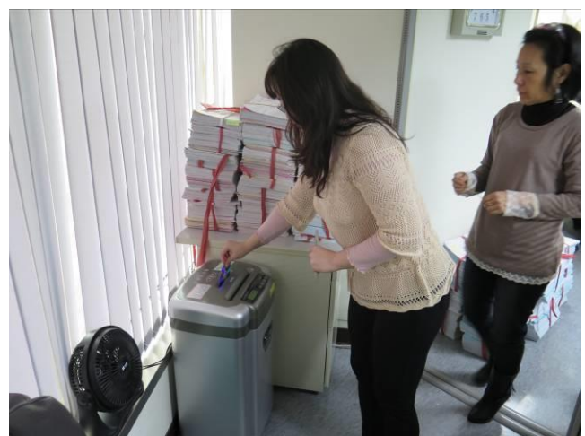
第二季媒體檔案銷毀情形(2)