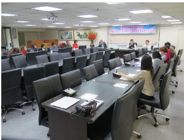
實習服務綜合座談情形(1)