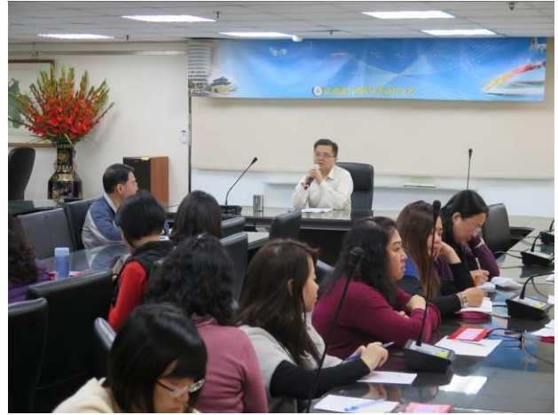
分署會議開會情形(2)