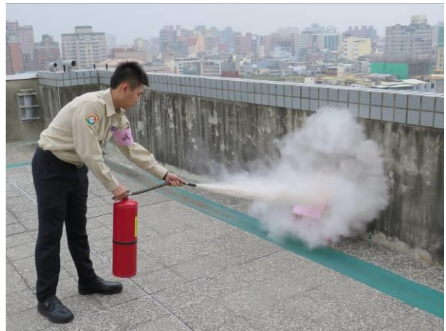
消防安全教育及天然災害避難演練情形(4)