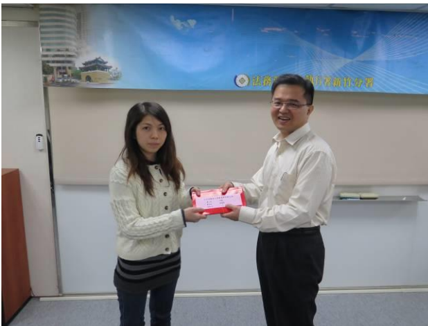
分署會議頒獎情形(1)