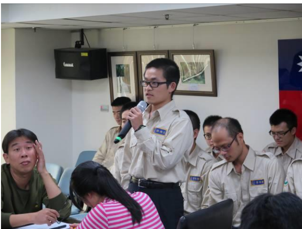
分署會議新進役男自我介紹情形(1)