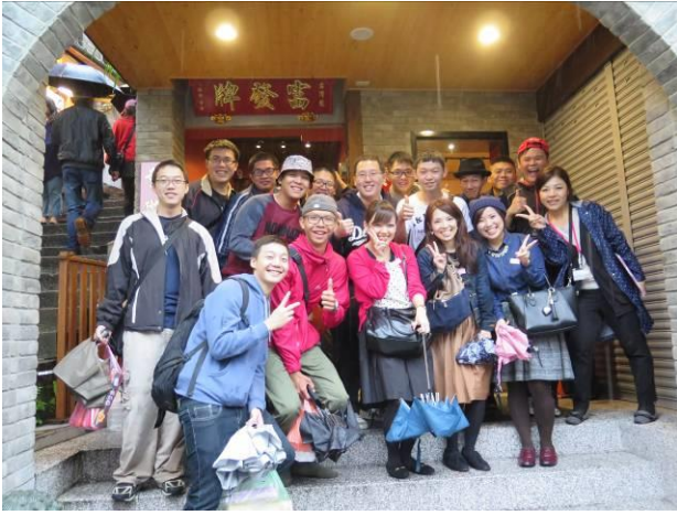
九份-自強活動情形(3)