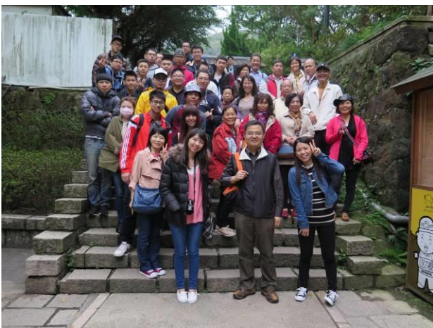
九份-自強活動情形(1)