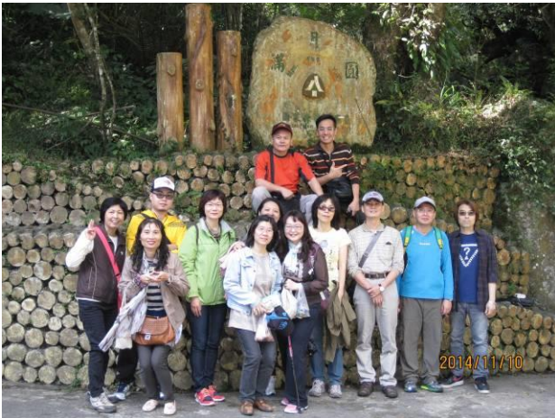
鶯歌-自強活動情形(1)