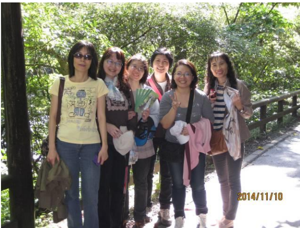
鶯歌-自強活動情形(3)