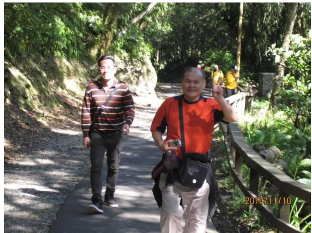
鶯歌-自強活動情形(4)