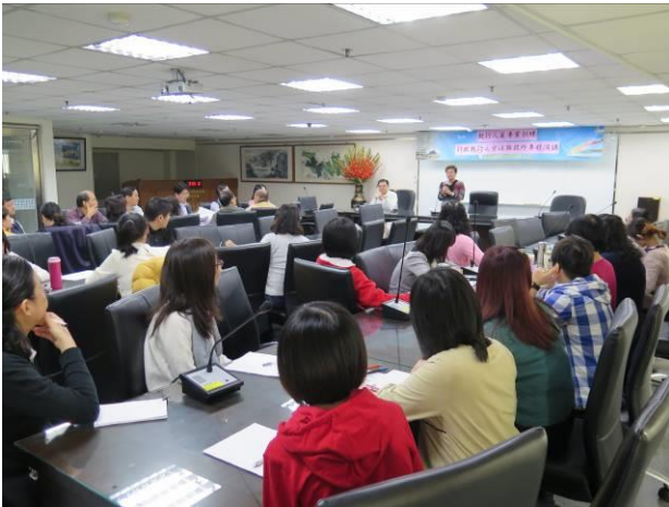
行政執行之方法與技巧專題演講情形(1)