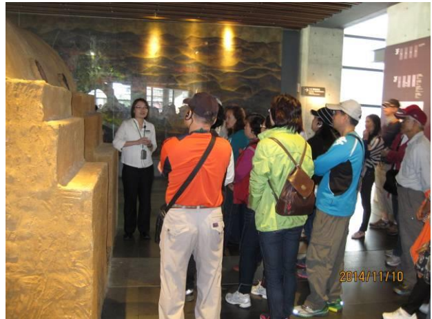
鶯歌-自強活動情形(2)