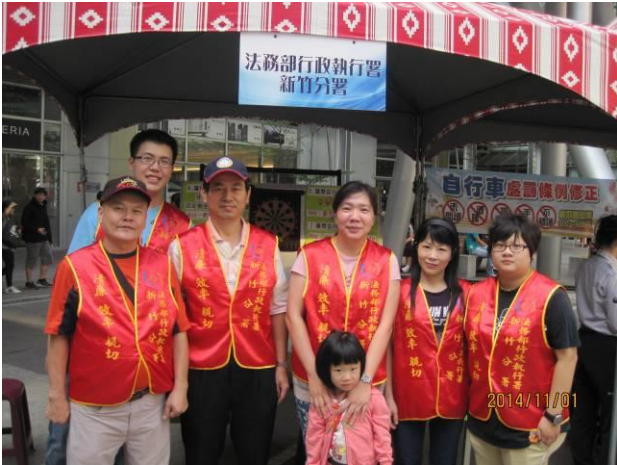
稅務宣導活動情形(1)