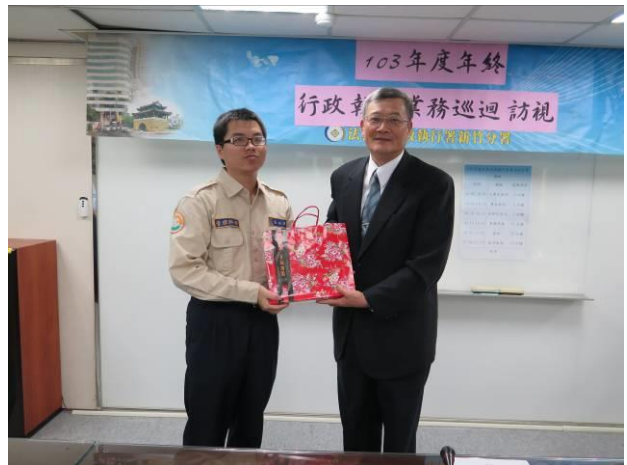
年終執行業務巡迴訪視頒獎情形(2)