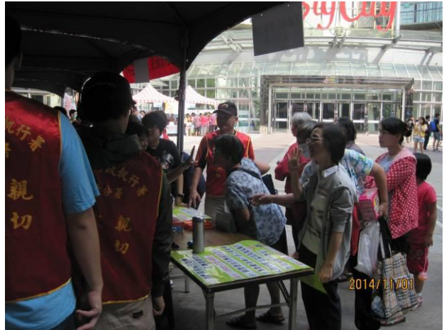
稅務宣導活動情形(2)