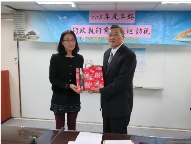
年終執行業務巡迴訪視頒獎情形(1)