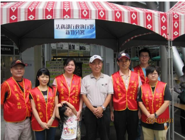
稅務宣導活動情形(3)