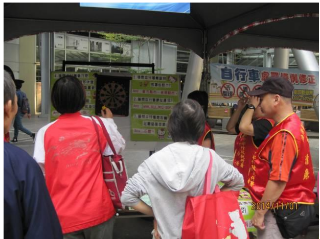
稅務宣導活動情形(4)