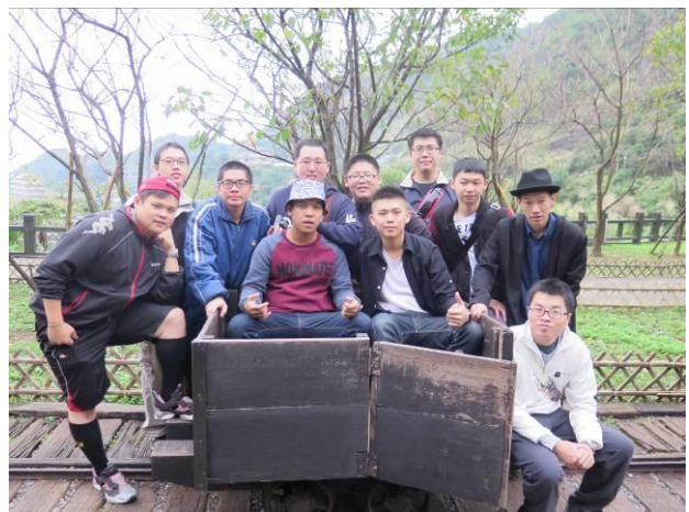
九份-自強活動情形(2)