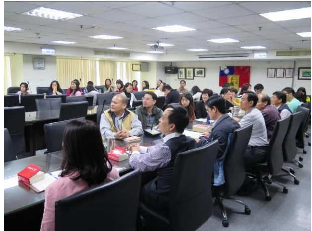
行政執行之方法與技巧專題演講情形(2)