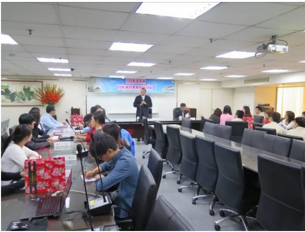
年終執行業務巡迴訪視情形(1)