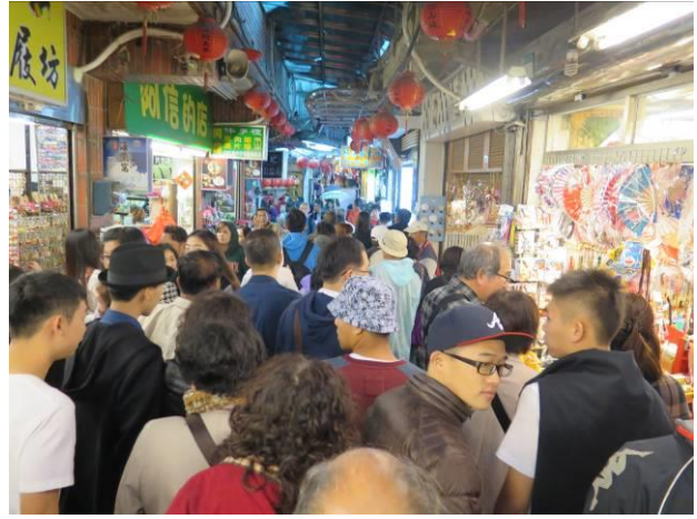
九份-自強活動情形(4)