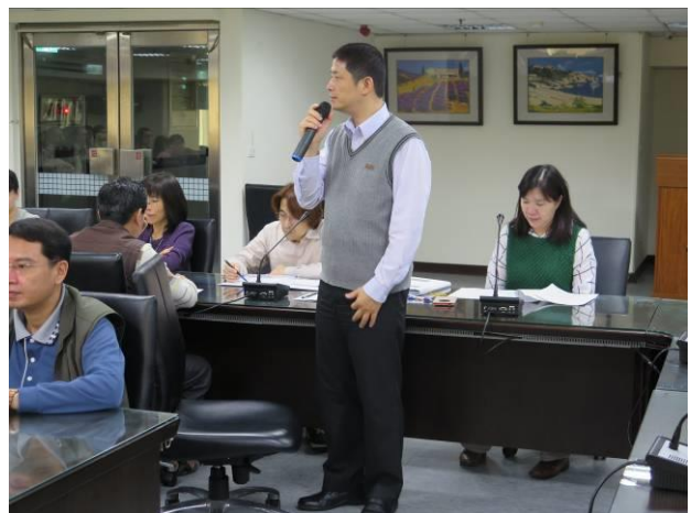
分署會議專員自我介紹情形(2)