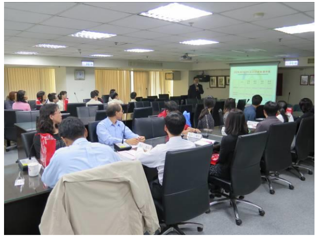
年終執行業務巡迴訪視情形(2)