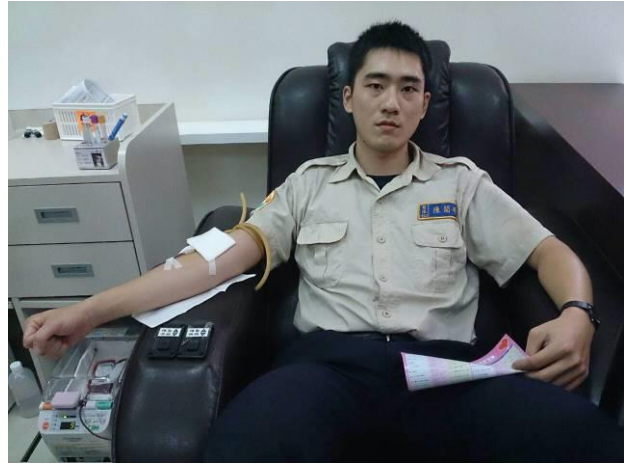
第二天役男捐血活動(2)