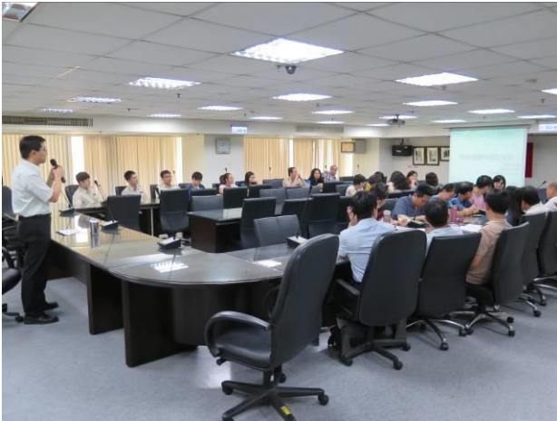
「個資保護與資訊安全」專題演講情形(1)