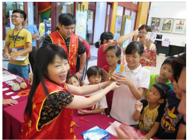
稅務宣導活動情形(4)