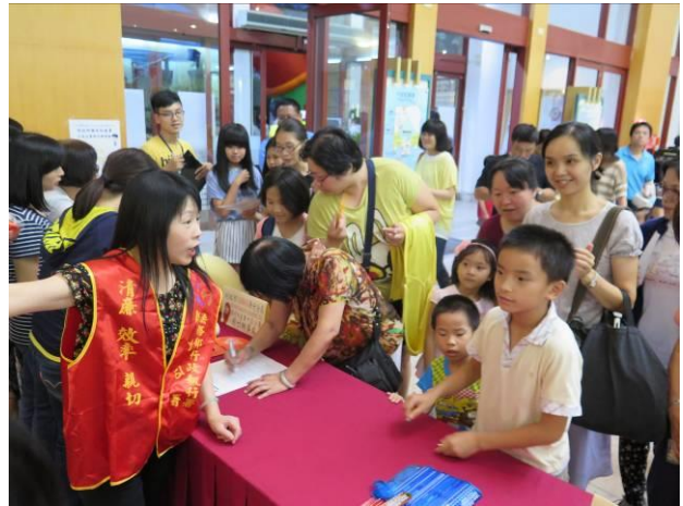
稅務宣導活動情形(2)