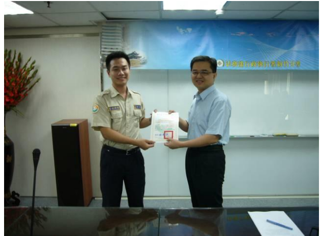
分署會議頒獎情形(2)