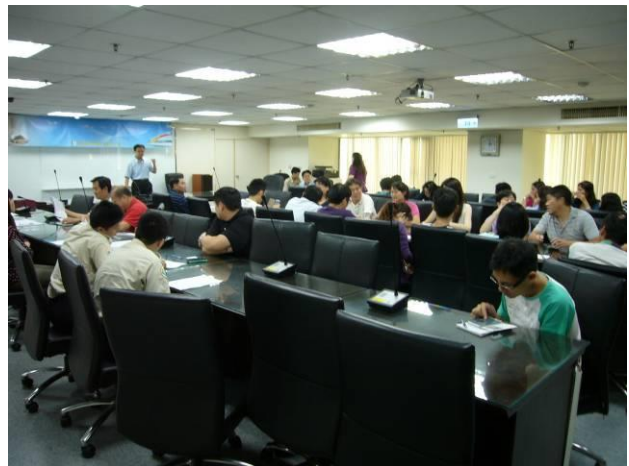
分署會議各組室報告(4)