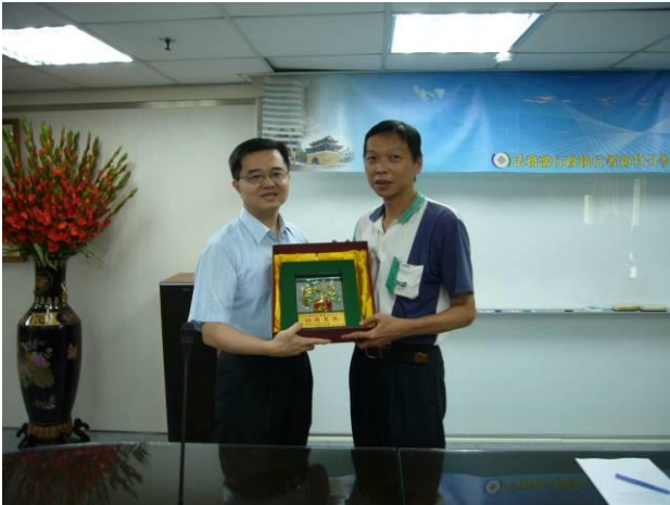
分署會議頒獎情形(1)