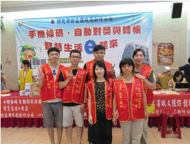
稅務宣導活動情形 (1)