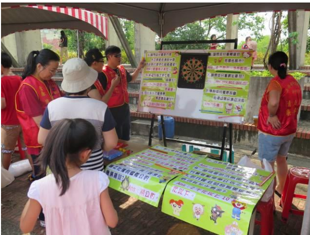
音樂饗宴活動情形(1)