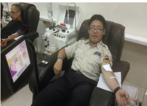
第一天役男捐血活動(1)