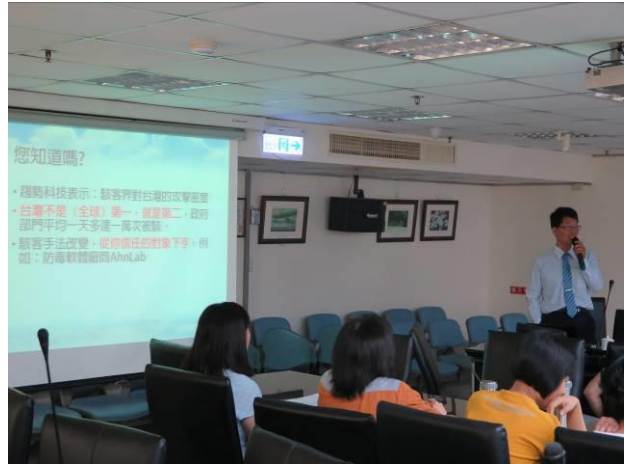
「個資保護與資訊安全」專題演講情形(2)