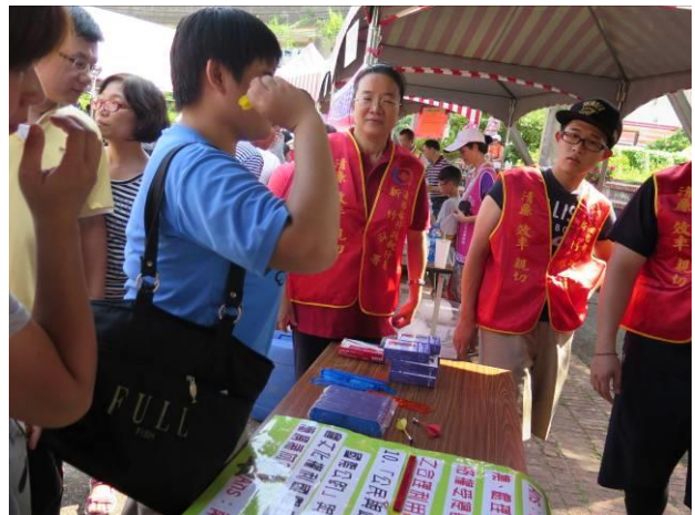
音樂饗宴活動情形(2)