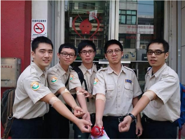
第二天役男捐血活動(1)