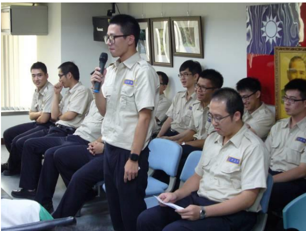
分署會議自我介紹(3)