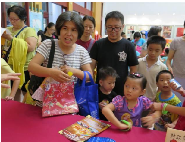
稅務宣導活動情形(3)