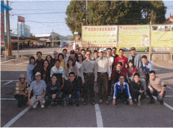
臺中東勢環境教育文康活動情形(1)