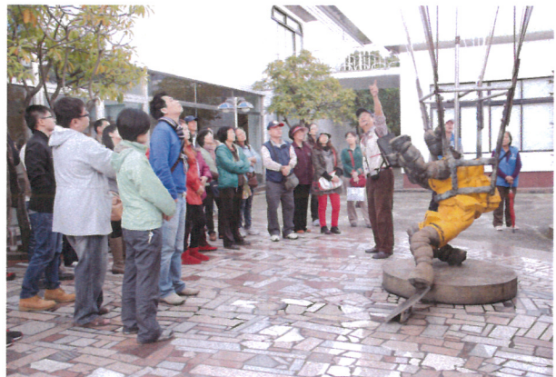
臺北金山-淡水環境教育文康活動(2)