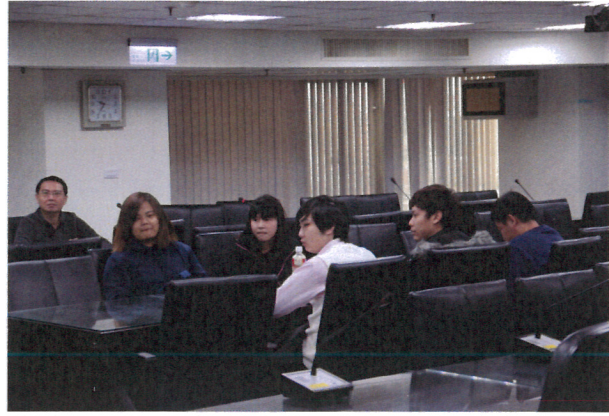
結訓綜合座談會情形(2)