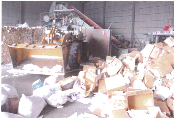
檔案銷毀作業情形(2)