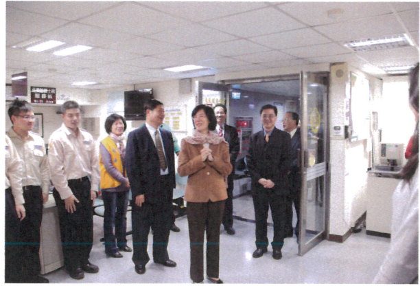
法務部羅部長瑩雪蒞臨本分署(2)