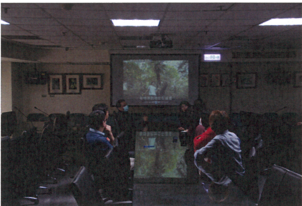
環境教育影片宣導情形(1)