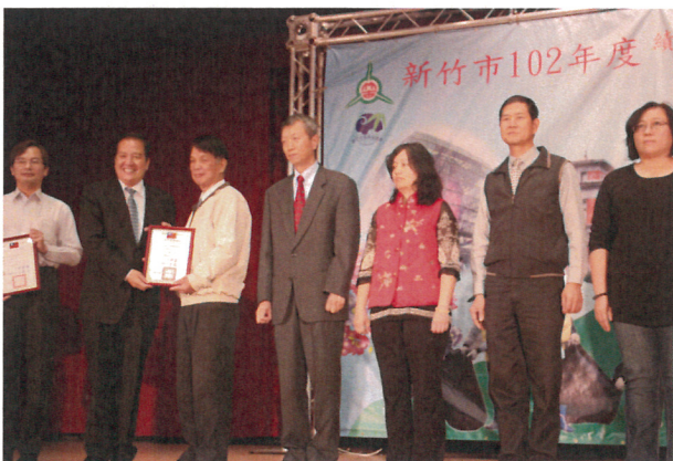
許市長明財頒發環境教育機關組獎狀