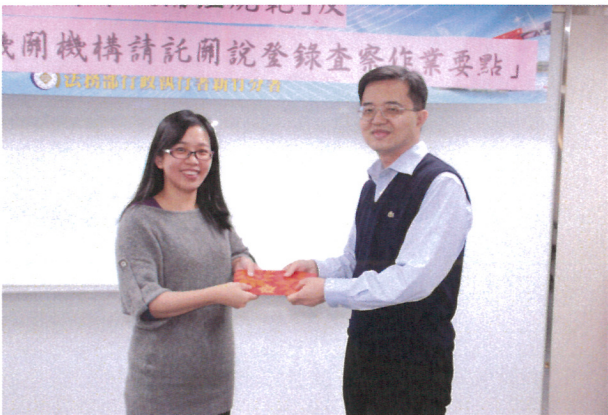
分署會議中頒發成績優良執行人原獎勵(1)