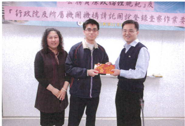
分署會議中頒發成績優良執行人原獎勵(2)