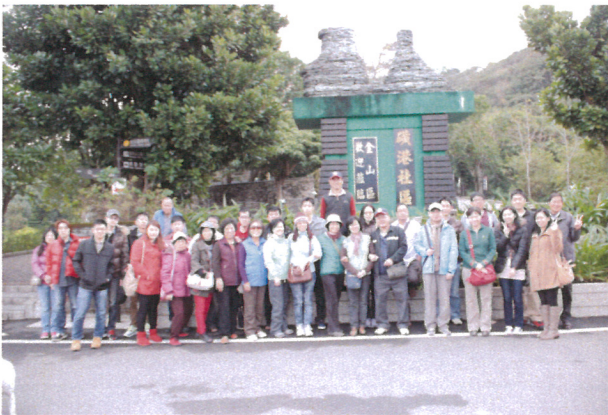
臺北金山-淡水環境教育文康活動(1)