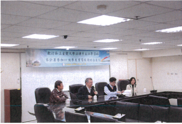
結訓綜合座談會情形(1)