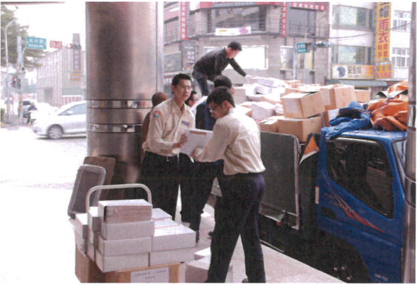
檔案銷毀作業情形(1)