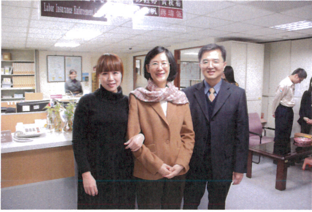
法務部羅部長瑩雪蒞臨本分署(1)