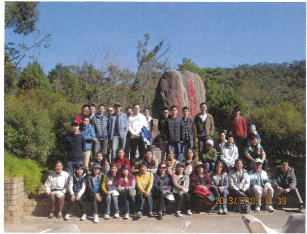
臺中東勢環境教育文康活動(2)